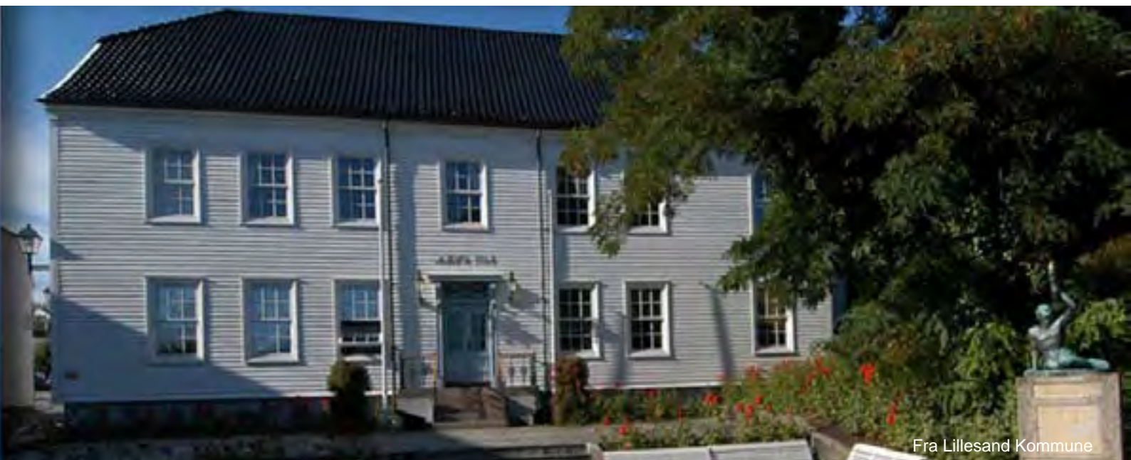
Fra Lillesand Kommune

Tilgjengelig tilgang på kapital er en nøkkelfaktor for verdiskaping. Et begrep som stadig trekkes frem er behovet for kompetent risikokapital. Dette innebærer at en investering inneholder kompetanse i tillegg til rene penger. I tillegg til å øke tilgangen på kapital, er det også behov for å øke bruken av